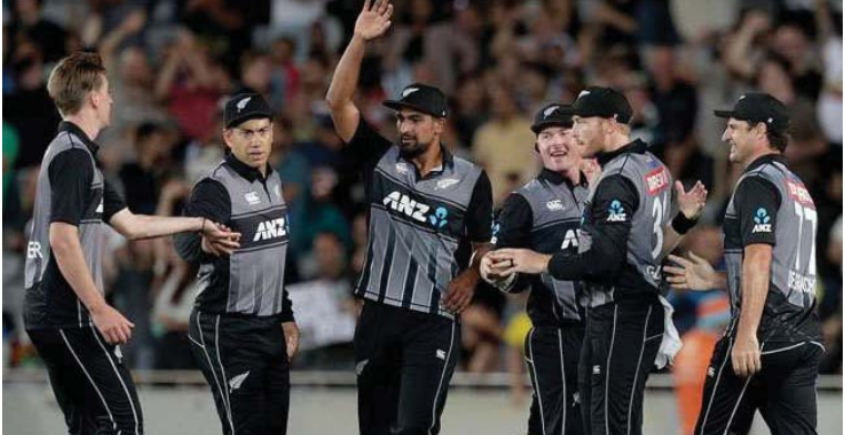
ਆਕਲੈਂਡ (ਐਨ. ਜ਼ੈਡ. ਤਸਵੀਰ) : ਨਿਊਜ਼ੀਲੈਂਡ ਵਾਇਰਸ ਮਹਾਂਮਾਰੀ ਦੇ ਕਾਰਨ ਕਈ ਮਹੀਨਿਆਂ ਤੋਂ ਇੰਟਰਨੈਸ਼ਨਲ ਕ੍ਰਿਕਟ ਖੇਡ ਸੀ। ਨਿਊਜ਼ੀਲੈਂਡ ਕ੍ਰਿਕਟ ਨੇ ਇੱਕ ਬਿਆਨ ਜਾਰੀ ਕਰਦਿਆਂ ਕਿਹਾ ਕਿ ਅਸੀਂ ਅੰਤਰਰਾਸ਼ਟਰੀ ਕ੍ਰਿਕਟ ਨੂੰ ਮਨਜ਼ੂਰੀ ਦੇ ਦਿੱਤੀ ਹੈ। ਹੁਣ ਅਸੀਂ ਨਵੰਬਰ ਵਿਚ ਵੈਸਟਇੰਡੀਜ਼ ਅਤੇ ਪਾਕਿਸਤਾਨ ਦੀ ਮੇਜ਼ਬਾਨੀ ਦਾ ਪ੍ਰੋਗਰਾਮ ਬਣਾ ਰਹੇ ਹਾਂ। ਹੁਣ ਤੱਕ ਪੁਰਸ਼ ਇੰਟਰਨੈਸ਼ਨਲ ਕ੍ਰਿਕਟ ਸਿਰਫ ਇੰਗਲੈਂਡ ਵਿਚ ਹੀ ਖੇਡੀ ਗਈ ਸੀ। ਜਦੋਂ ਕਿ ਲੀਗ ਕ੍ਰਿਕਟ ਕਈ ਦੇਸ਼ਾਂ ਵਿਚ ਸ਼ੁਰੂ ਹੋ ਚੁੱਕੀ ਹੈ। ਹਾਲਾਂਕਿ ਮਹਿਲਾ ਕ੍ਰਿਕਟ ਦਾ ਆਯੋਜਨ ਵੀ ਹੌਲੀ ਹੌਲੀ ਸ਼ੁਰੂ ਹੋਵੇਗਾ। ਵੈਸਟਇੰਡੀਜ਼ ਨੂੰ ਨਿਊਜ਼ੀਲੈਂਡ ਵਿਚ ਉਸੇ ਦੇ ਖਿਲਾਫ ਤਿੰਨ ਮੈਚਾਂ ਦੀ ਟੀ 20 ਵਿਚ ਅਤੇ ਫਿਰ 2 ਮੈਚਾਂ ਦੀ ਟੈਸਟ ਸੀਰੀਜ਼ ਵਿਚ ਉਤਰਨਾ ਹੋਵੇਗਾ। ਉਥੇ ਹੀ ਪਾਕਿਸਤਾਨ ਨੂੰ ਕੀਵੀ ਟੀਮ ਦੇ ਖਿਲਾਫ ਤਿੰਨ ਟੀ 20 ਮੈਚ ਅਤੇ 2 ਮੈਚਾਂ ਦੀ ਟੈਸਟ ਸੀਰੀਜ਼ ਨੂੰ ਖੇਡਣਾ ਹੋਵੇਗਾ।

ਕਿਹਾ ਕਿ ਅਸੀਂ ਅੰਤਰਰਾਸ਼ਟਰੀ ਕ੍ਰਿਕਟ ਨੂੰ ਮਨਜ਼ੂਰੀ ਦੇ ਦਿੱਤੀ ਹੈ। ਹੁਣ ਅਸੀਂ ਨਵੰਬਰ ਵਿਚ ਵੈਸਟਇੰਡੀਜ਼ ਅਤੇ ਪਾਕਿਸਤਾਨ ਦੀ ਮੇਜ਼ਬਾਨੀ ਦਾ ਪ੍ਰੋਗਰਾਮ ਬਣਾ ਰਹੇ ਹਾਂ। ਹੁਣ ਤੱਕ ਪੁਰਸ਼ ਇੰਟਰਨੈਸ਼ਨਲ ਕ੍ਰਿਕਟ ਸਿਰਫ ਇੰਗਲੈਂਡ ਵਿਚ ਹੀ ਖੇਡੀ ਗਈ ਸੀ। ਜਦੋਂ ਕਿ ਲੀਗ ਕ੍ਰਿਕਟ ਕਈ ਦੇਸ਼ਾਂ ਵਿਚ ਸ਼ੁਰੂ ਹੋ ਚੁੱਕੀ ਹੈ। ਹਾਲਾਂਕਿ ਮਹਿਲਾ ਕ੍ਰਿਕਟ ਦਾ ਆਯੋਜਨ ਵੀ ਹੌਲੀ ਹੌਲੀ ਸ਼ੁਰੂ ਹੋਵੇਗਾ। ਵੈਸਟਇੰਡੀਜ਼ ਨੂੰ ਨਿਊਜ਼ੀਲੈਂਡ ਵਿਚ ਉਸੇ ਦੇ ਖਿਲਾਫ ਤਿੰਨ ਮੈਚਾਂ ਦੀ ਟੀ 20 ਵਿਚ ਅਤੇ ਫਿਰ 2 ਮੈਚਾਂ ਦੀ ਟੈਸਟ ਸੀਰੀਜ਼ ਵਿਚ ਉਤਰਨਾ ਹੋਵੇਗਾ। ਉਥੇ ਹੀ ਪਾਕਿਸਤਾਨ ਨੂੰ ਕੀਵੀ ਟੀਮ ਦੇ ਖਿਲਾਫ ਤਿੰਨ ਟੀ 20 ਮੈਚ ਅਤੇ 2 ਮੈਚਾਂ ਦੀ ਟੈਸਟ ਸੀਰੀਜ਼ ਨੂੰ ਖੇਡਣਾ ਹੋਵੇਗਾ।